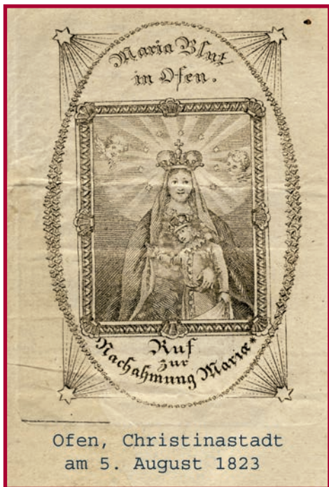
4. kép. Szentkép (1823)