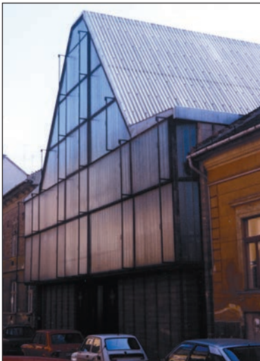
5. kép. Táltos utcai Szent Kereszt-templom