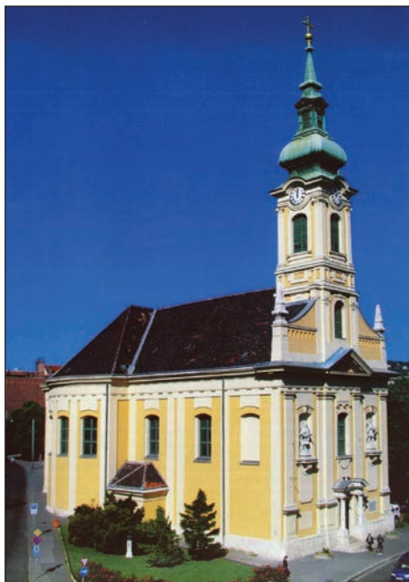
1. kép. Krisztinavárosi Havas Boldogasszony-templom (L. L.)